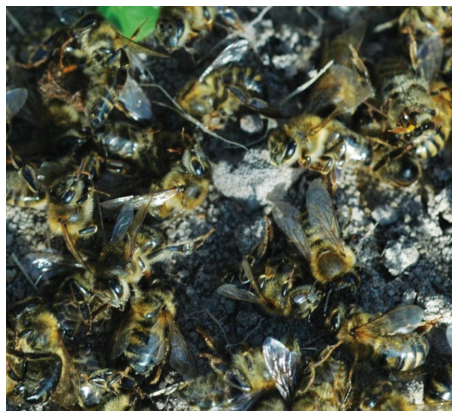
Martwe pszczoły przed ułem.