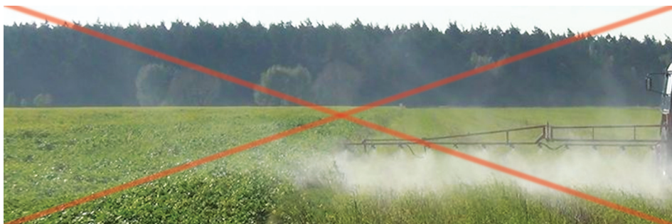
Znoszenie cieczy użytkowej stanowi zagrożenie dla zapylaczy na sąsiadujących plantacjach, na których pszczoły mają pożytek.